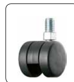
Kunststoff-Doppelrolle F 60 (2 cm höher als F 49)