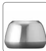
Alufuß F 49 glänzend