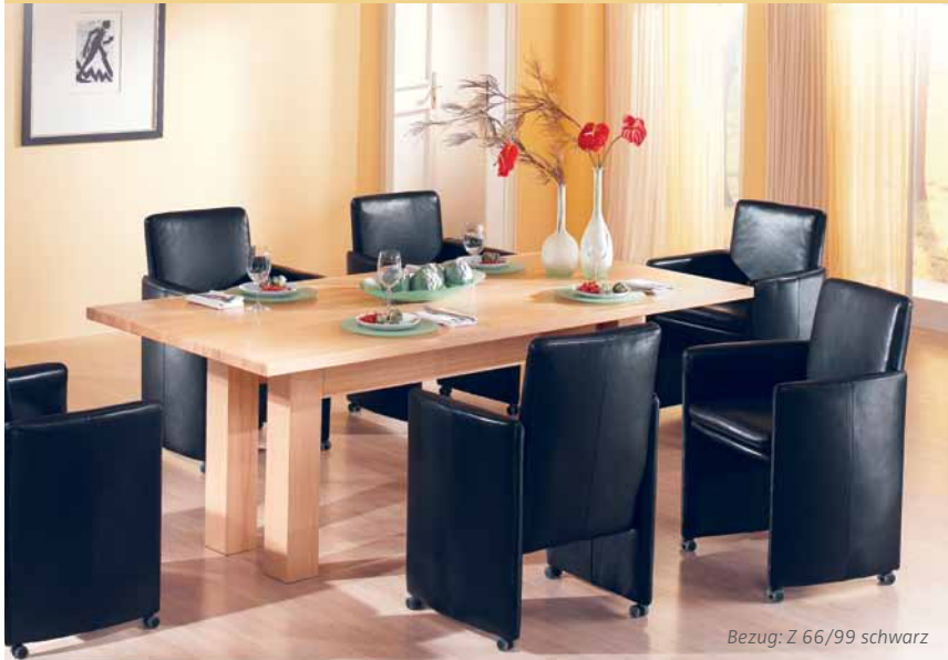
Bezug: Z 66/99 schwarz