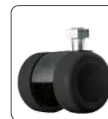
Parkettrolle F 84 (2 cm höher als F 49)

Fuß- und Sitzhöhen: Die Füße F 60 und F 84 sind 2 cm höher, dadurch ändert sich die Sitzhöhe auf 51 cm und die Armlehnenhöhe auf 68 cm.