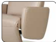
S 002 Aufmaß + 2 cm