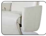
S 002 Aufmaß + 2 cm