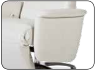
S 003 Aufmaß + 8 cm