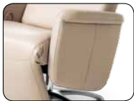
S 003 Aufmaß + 8 cm