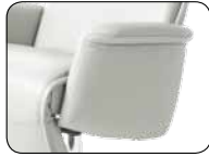
S 004 Aufmaß + 9 cm