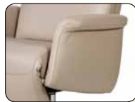
S 004 Aufmaß + 9 cm