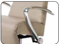
S 001 chromglänzend, gegen Aufpreis