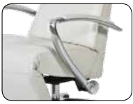
S 001 chromglänzend, gegen Aufpreis