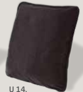
U 14, Bezug A60/53 espresso (Charmelle)