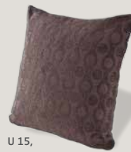
U 15, Bezug C06/54 braun