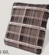
U 60, Bezug E40/95 anthrazit