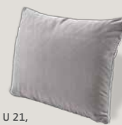
U 21, Bezug A60/23 stone (Charmelle)