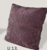
U 13, Bezug C06/86 aubergine