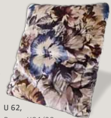
U 62, Bezug H84/28 blau