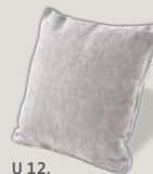
U 12, Bezug C06/22 silbergrau