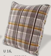
U 16, Bezug C07/22 rock