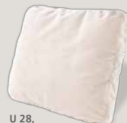
U 28, Bezug A60/43 natur (Charmelle)