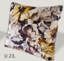
U 23, Bezug H84/72 curry